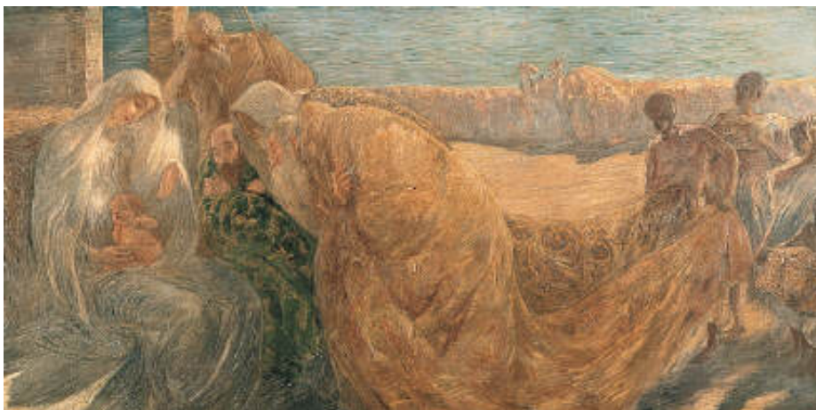
A sinistra: Gaetano Previati, Adorazione dei Magi , 1982, Milano, Pinacoteca di Brea

Nessuno può dire: ho la verità- questa è l'obiezione che si muove- e, giustamente, nessuno può avere la verità. E' la verità che ci possiede, è qualcosa di vivente! Noi non siamo suoi possessori, bensì siamo afferrati da lei. Dio ci è diventato così vicino che Egli stesso è un uomo: questo ci deve sconcertare e sorprendere sempre di nuovo! Egli è così vicino che è uno di noi. Conosce l'essere umano, lo conosce dal di dentro, lo ha portato con le sue gioie e le sue sofferenze. Come uomo, mi è vicino, vicino "a portata di voce"